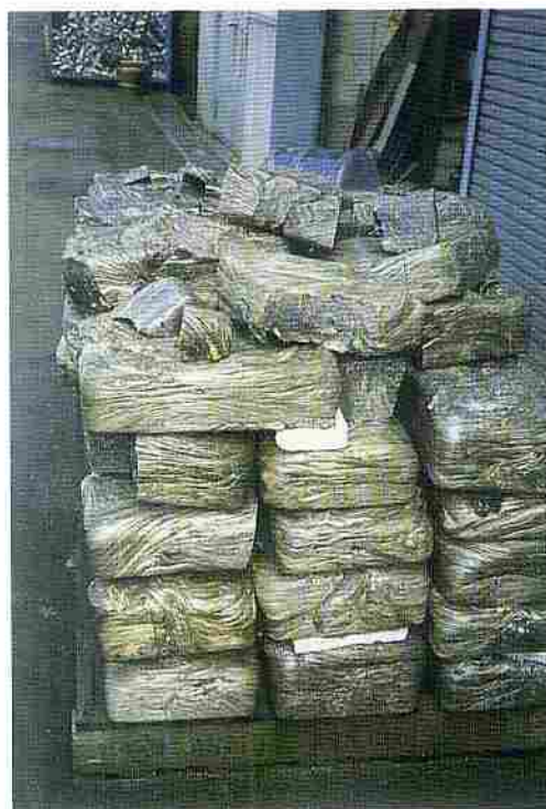
とかされたスチールトレイ