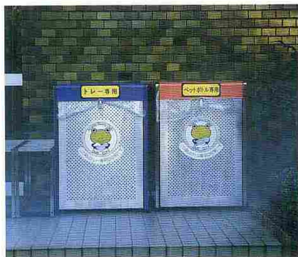
ペットボトル・トレイの回収ボックス