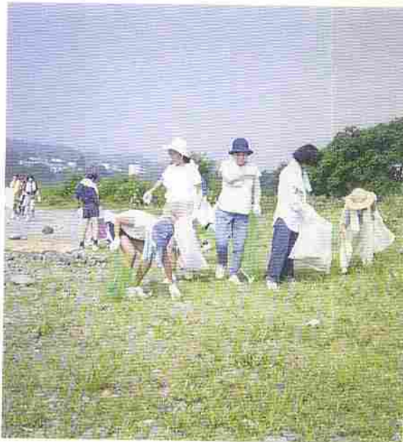
多摩川いっせい せいそう 清掃

毎年、8月の日よう日には、 た 多摩川にそった地いきの人たちが、いっしょになって、 かわら 河原や川の中をきれいにする運動をすすめています。その時には、たくさんのゴミが出てきます。