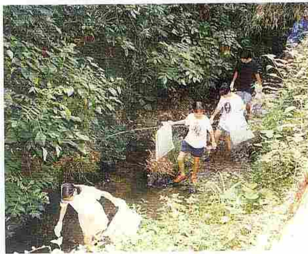
黒沢川の大そうじ