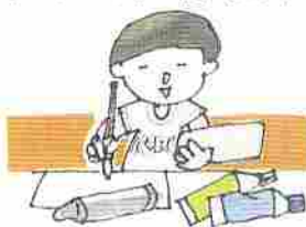
クレヨン 絵の具 カップ ラーメン